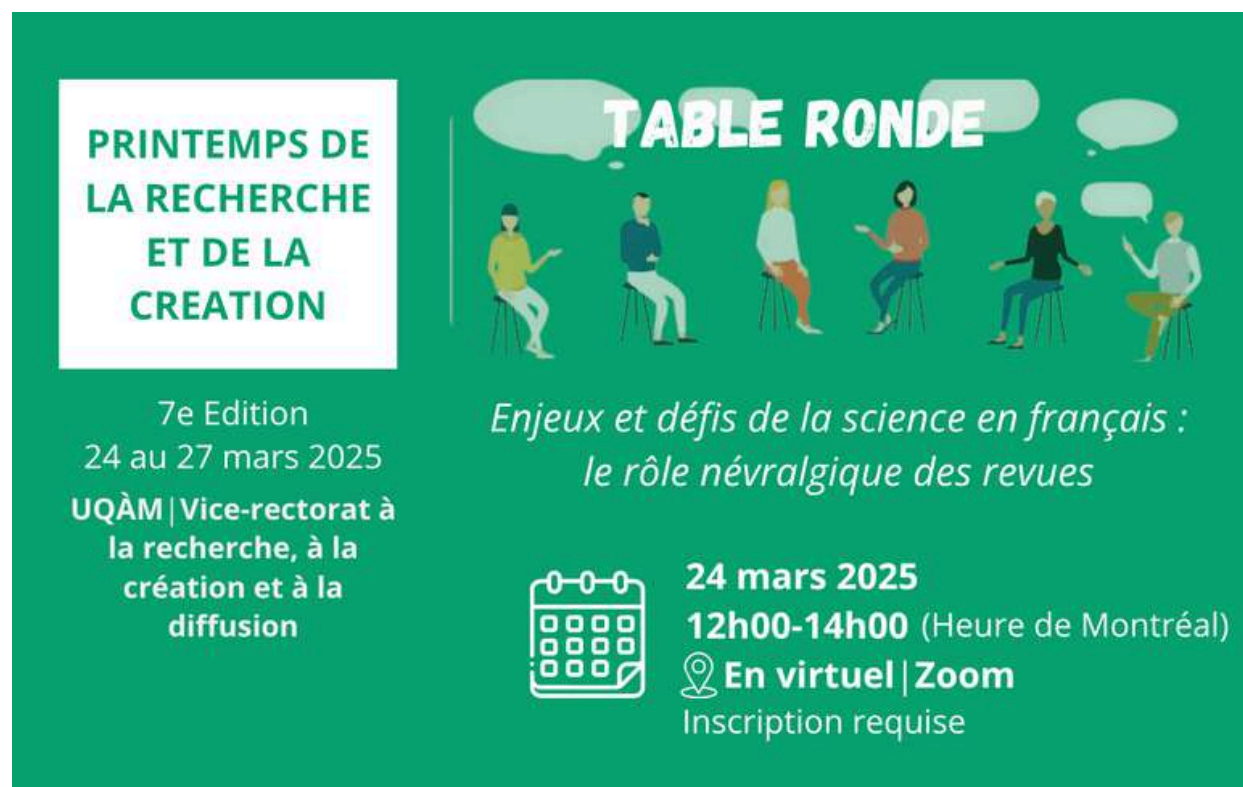
TABLE RONDE SUR LES ENJEUX ET DÉFIS DE LA SCIENCE EN FRANÇAIS DANS LE CADRE DU PRINTEMPS DE LA RECHERCHE ET DE LA CRÉATION DE L'UQAM

Dans le cadre de la semaine de la Francophonie , Orbicom organise une table ronde le 24 mars 2025 , lors de la 7 e édition du Printemps de la recherche et de la création de l'UQAM , qui se déroulera du 24 au 27 mars 2025. La table ronde portera sur le thème « Enjeux et défis de la science en français : le rôle central des revues », afin de mettre en évidence l'importance de la diffusion scientifique en langue française.