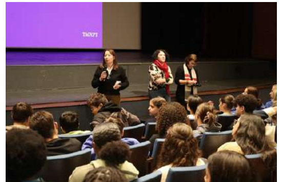
Initiative « Le cinéma vous attend », avec la projection du film « Minamata » d'Andrew Levitas (Sofia Martins, TAGV)